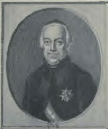
Le chanoine Escoïquiz.